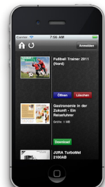
4. Nutzung: Personalisierte Kiosk-App auf iPhone & iPad für das Lesen und Konsumieren der Publikationen. Benutzer- und Gruppenzuordnung erlaubt das geschützte und gezielte Verteilen von Inhalten.