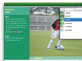
3. Viele zusätzliche Funktionen für das komfortable Lesen der Dokumente innerhalb der App. Wie z.B. die integrierte Volltextsuche, Zoomen, Kapitelübersicht und Navigation.