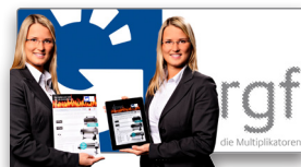
Der RGF Folder in der RGF App.

Ihre Kiosk-App lässt sich einfach an Ihre Corporate-Identity (CI) anpassen. Wählen Sie ein Farbschema, Logos, Hintergrundbilder und Icons aus, und erzeugen Sie so Ihr ganz persönliches Look & Feel.