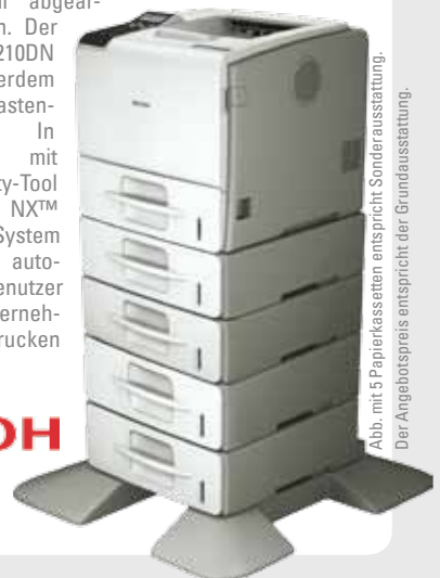
Abb. mit 5 Papierkassetten entspricht Sonderausstattung. Der Angebotspreis entspricht der Grundausstattung.

Produktivität. Die Standard-Papierkapazität liegt bei 650 Blatt und kann optional auf bis zu 2.850 Blatt erweitert werden. So können auch größere Druckaufträge schnell abgearbeitet werden. Der Aficio™ SP 5210DN verfügt außerdem über ein 10-Tasten-Bedienpanel. In Kombination mit dem Security-Tool Ricoh ELP NX™ sorgt das System dafür, dass autorisierte Benutzer überall im Unternehmen sicher drucken können.